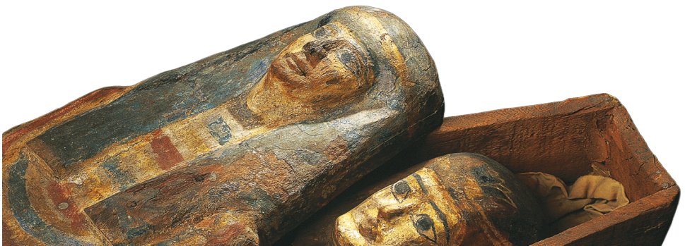
Åldern på en mumie från Alexandria, Egypten kunde bestämmas till 250 år f Kr. med hjälp av kol-14-datering. Gustavianium, Uppsala universitet

Kol-14-datering är ett välkänt verktyg inom forskningsfält som historia, arkeologi och geologi, men används också inom medicinsk forskning, till exempel för att bestämma cellers livslängd. Åldersbestämning med hjälp av kol-14 används också inom konstvärdering och kriminalteknik.