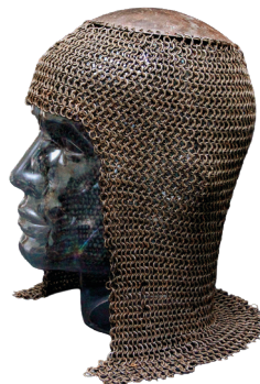
Ringbrynjehuva åldersbestämd till omkring år 1300 med kol-14-metoden. Enköpings museum.

Provpredparation och accelerator-masspektrometri utförs vid Tandemlaboratoriet, Uppsala universitet och vid Miljö- och geovetenskapliga institutionen, Lunds universitet.